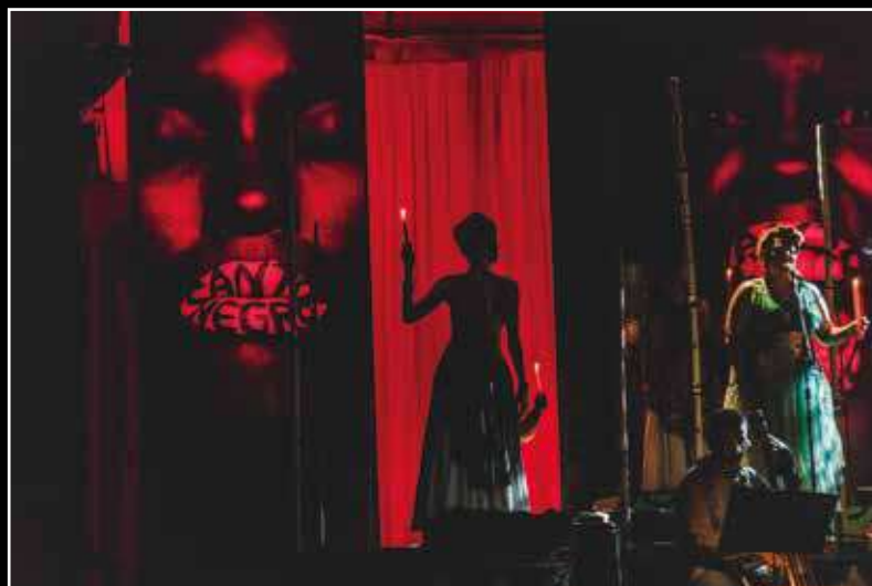
CANTO NEGRO Roteiro e Direção Luiz Fernando Lobo Direção Musical Túlio Mourão Armazém da Utopia