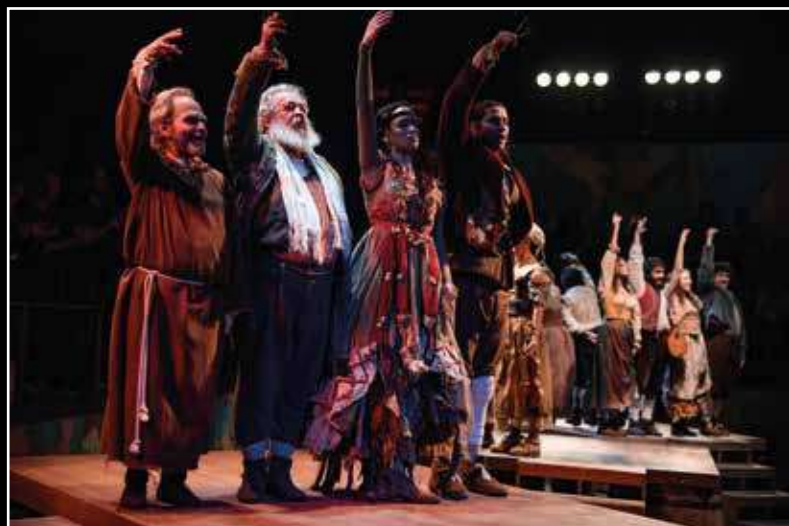
A MANDRÁGORA de Maquiavel Armazém da Utopia