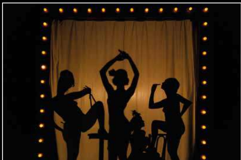
LUZ NAS TREVAS de Bertolt Brecht Armazém da Utopia